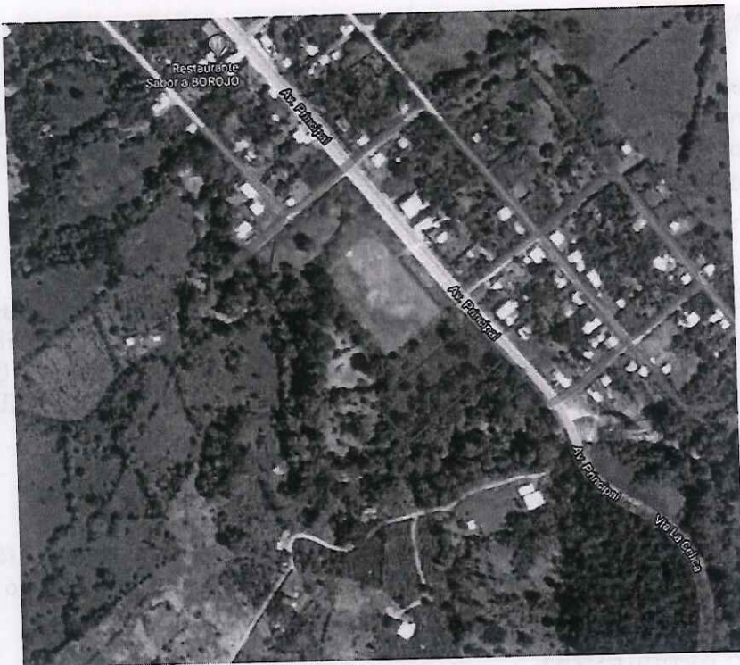
Ilustración 1- Ubicación Subestación Pedro Vicente Maldonado

El predio donde se emplazará la Subestación se encuentra ubicado en la Provincia de Pichincha, Parroquia Pedro Vicente Maldonado, Cantón Pedro Vicente Maldonado, entre las intersecciones de la Av. Principal y la Vía Cética.